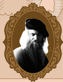
LEONARDO April 15, 1452

"A PESTO A PERFEITA MISTURA MAIS IMPROVÁVEL, QUE TANTO É REFRESCANTE QUANTO RICA. TENHO UM FASCÍNIO POR CULTURAS DIFERENTES E EXPERIÊNCIAS DESCONHECIDAS, ESTE SABOR É SIMPLEMENTE ÚNICO." "THE PESTO, THE MOST IMPROBABLE PERFECT BLEND, BOTH REFRESHING AND RICH. I HAVE A FASCINATION FOR DIFFERENT CULTURES AND UNKNOWN EXPERIENCES, AND THIS FLAVOUR IS SIMPLY UNIQUE." "COMO DESCOBRIR UM TESOURO ESCONDIDO, DIGNA DE UM VERDADEIRO EXPLORADOR." "LIKE DISCOVERING A HIDDEN TREASURE, WORTHY OF A TRUE EXPLORER." "ESQUEÇAM AS ESPECIARIAS DA ÍNDIA, O VERDADEIRO TESOURO ESTÁ AQUI!" "FORGET THE SPICES OF INDIA, THE REAL TREASURE IS HERE!"