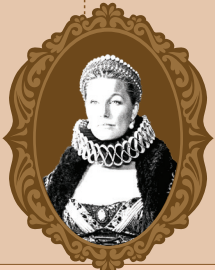
JOANA November 6, 1479

"A MARINARA A PERFEITA COMBINAÇÃO. TRANSFORMA INGREDIENTES BÁSICOS EM UMA EXPERIÊNCIA CULINÁRIA PROFUNDAMENTE INCRÍVEL." "THE MARINARA, THE PERFECT COMBINATION. IT TURNS BASIC INGREDIENTS INTO A DEEPLY AMAZING CULINARY EXPERIENCE." "SIMPLICIDADE NA PIZZA É A SOFISTICAÇÃO MÁXIMA." "SIMPLICITY IN PIZZA IS THE ULTIMATE SOPHISTICATION." "A ÚLTIMA CEIA TERIA SIDO AINDA MAIS LENDÁRIA COM A PIZZA DO FONTINHA NA MESA." "THE LAST SUPPER WOULD HAVE BEEN EVEN MORE LEGENDARY WITH FONTINHA'S PIZZA ON THE TABLE."