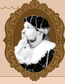
WILLIAM April 23, 1564

"SABOR AUTÊNTICO...? NEM É UMA QUESTÃO." "AUTHENTIC FLAVOUR...? THAT'S NOT EVEN A QUESTION." "PROSCIUTTO, TÃO DIRETO, MAS AO MESMO TEMPO TÃO SOFISTICADO, LEMBRA-ME HAMLET." "PROSCIUTTO, SO STRAIGHTFORWARD YET SO SOPHISTICATED, IT REMINDS ME OF HAMLET." "ESTAS PIZZAS SÃO TÃO MARAVILHOSAS QUE FARIAM ATÉ CALIBAN CANTAR EM A TEMPESTADE." "THESE PIZZAS ARE SO WONDERFUL THEY WOULD MAKE CALIBAN SING IN THE TEMPEST."