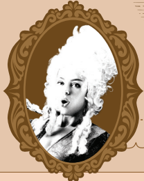
MARIA November 2, 1755

"SABOR AUTÊNTICO...? NEM É UMA QUESTÃO." "AUTHENTIC FLAVOUR...? THAT'S NOT EVEN A QUESTION." "PROSCIUTTO, TÃO DIRETO, MAS AO MESMO TEMPO TÃO SOFISTICADO, LEMBRA-ME HAMLET." "PROSCIUTTO, SO STRAIGHTFORWARD YET SO SOPHISTICATED, IT REMINDS ME OF HAMLET." "ESTAS PIZZAS SÃO TÃO MARAVILHOSAS QUE FARIAM ATÉ CALIBAN CANTAR EM A TEMPESTADE." "THESE PIZZAS ARE SO WONDERFUL THEY WOULD MAKE CALIBAN SING IN THE TEMPEST."