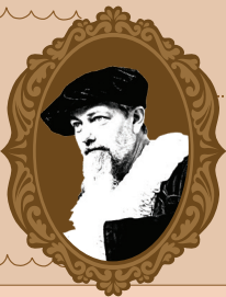
FERNÃO April, 1480

"DELICIOSAS! DE PERDER A CABEÇA!" "DELICIOUS! ABSOLUTELY MIND-BLOWING!" "CAPRICCIOSA, IDEAL PARA UM PALADAR REFINADO." "CAPRICCIOSA, IDEAL FOR A REFINED PALATE." "SABIAS QUE AS ALCACHOFRAS FORAM CONSIDERADAS UM INGREDIENTE DE LUXO NA EUROPA NO SÉCULO XVIII?" "DID YOU KNOW THAT ARTICHOKES WERE CONSIDERED A LUXURY INGREDIENT IN EUROPE IN THE 18TH CENTURY?"